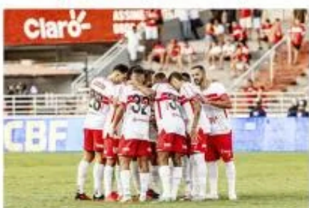
Apesar do bom momento, o time alagoano ocupa a 12ª colocação na tabela

Após as três vitórias consecutivas, o CRB, que chegou a ocupar a 18ª posição, respirou na bri-