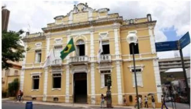
Dos 21 vereadores da atual Legislatura, 20 concorrem à reeleição; ano a ano é grande a renovação nas eleições para a Câmara de Uberaba

Embora a maioria já esteja pensando em se manter em uma das cadeiras do Legislativo municipal, os