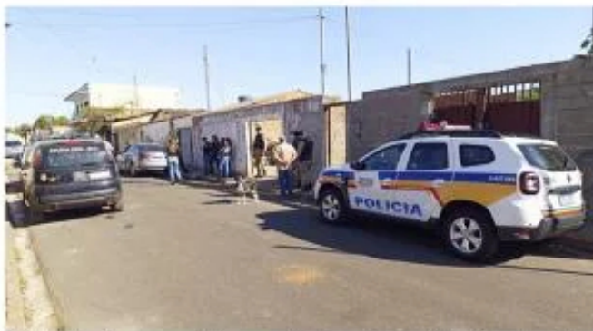
Policiais localizaram o veículo na manhã de ontem, no Chica Ferreira

Os dois seguem pela via e foram perseguidos por cinco bandidos que estava em um veículo Volkswagen Gol. Ao pararem os automóveis para irem até a casa de familiares, eles foram abordados pelos cinco bandidos, que estavam armados e anunciaram o roubo. Os criminosos