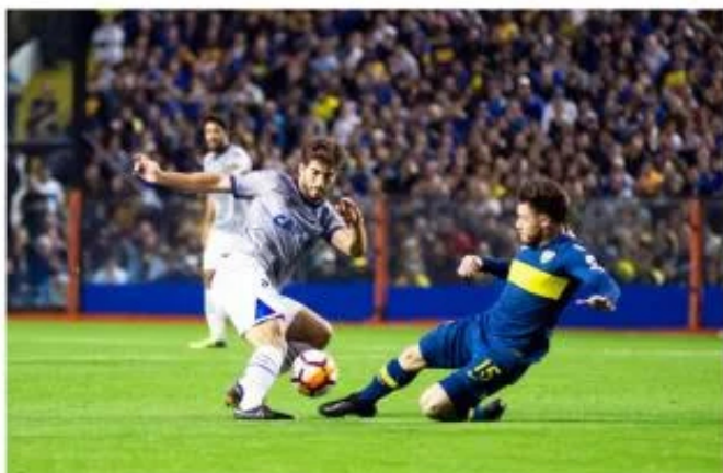
A última vez que Cruzeiro e Boca Juniors se enfrentaram foi pela Libertadores de 2018

A Conmebol definiu em sorteio realizado em Luque, no Paraguai, em maio deste ano, que as oitavas do torneio serão disputadas nas semanas de 14 e 21 de agosto. De acordo com a entidade, o jogo de ida será na semana de 14 de agosto, enquanto a partida de volta está prevista para a semana de 21 do mesmo mês. As datas exatas e os horários serão divulgados pela Conmebol