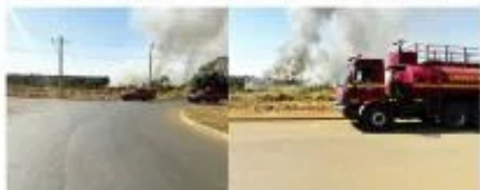
Militares apagaram o fogo na tarde de hoje

Após receberem vários chamados (via 193) as equipes com seis viaturas de combate a incêndio e