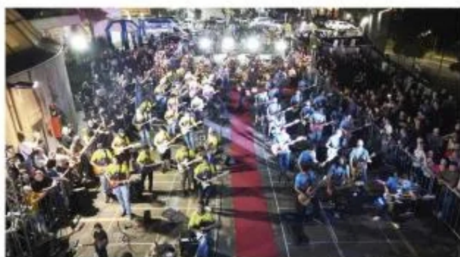
O The Center Music Fest acontece dia 3 de agosto, a partir das 17h, a praça Pôr do Sol reunindo 150 músicos em um espetáculo emocionante e gratuito

O festival promete uma viagem musical inesquecível, com um repertório que inclui músicas que marcaram gerações. Será uma oportunidade única para os moradores da cidade e visitantes desfrutarem de uma tarde repleta de