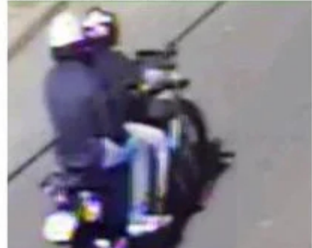
Assaltantes foram flagrados por câmeras antes do crime

abordados e identificados como um jovem de 24 anos que saiu da penitenciária de Uberaba no dia 4 de junho após ter a prisão por furto revogada pela Justiça, e um adolescente de 17 anos. Durante as verificações e buscas, os policiais encontraram as ferramentas utilizadas no crime e recuperaram a fiação subtraída. As equipes entraram em contato com o Conselho Tutelar e uma conselheira acompanhou o adolescente apreendido. Os suspeitos de furto detidos foram levados até a delegacia de Polícia Civil e apresentados à autoridade de Polícia Judiciária.