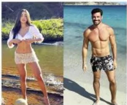
Ator Cauã Reymond vivia um affair secreto com a mineira Luiza Watson, de 29 anos

na terra natal de Luana, batendo a cabeça e perdendo a consciência na água.