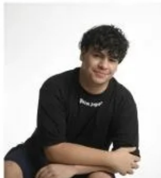
O gato Thomaz Bruce Fonseca Pantaleão de Oliveira fez aniversário no dia 24 de julho e ganhou abraços carinhosos.