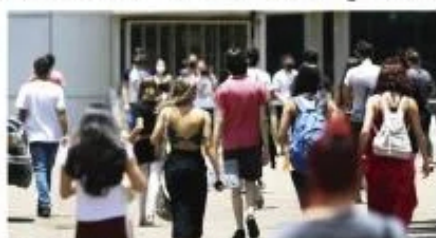
Complementação de informações de pré-selecionados começa dia 31 – Foto: Marcello Casal JR/Agência Brasil

Passo a passo – Para a contratação do financiamento os candidatos pré-selecionados do Fies devem complementar as informações da inscrição no sistema. O acesso é por meio de login e senha na conta no portal de ser-