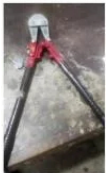
Ferramenta usada no crime foi apreendida com os bandidos

Um homem com várias passagens pelos meios policiais foi preso e um adolescente foi apreendido minutos após cometerem um furto no município. Fiação elétrica e ferramentas foram apreendidas com os envolvidos.