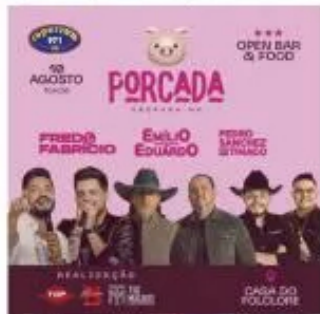
No dia 10 de agosto, a Casa do Folclore em Uberaba será palco da Porcada 2024, uma festa que promete agitar a cidade com muita música, comida deliciosa e diversão garantida.