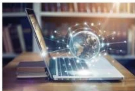
Segundo a coordenação do curso, as inscrições serão feitas em agosto e as aulas terão início na terceira semana de outubro

O MEC criou uma página na internet – http://portal.fies.mec.gov.br/index.php?pagina=fag#complementacao – com um tira-dúvidas sobre o Fies.